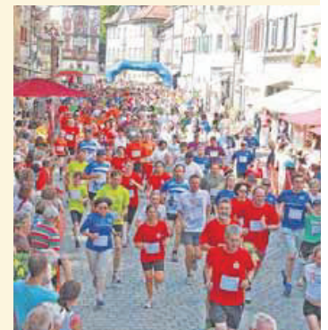
Nach dem Hauptlauf lockt die Altstadt-Hockete auf dem Markt- und Postplatz.

Anmelden können sich Läufer unter www.mtg-wangen.de oder bei Reinhold Meindl: 07522/909224.