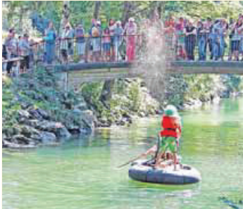
Spaß- und Rennboote starten zur Freude der Gäste am und im Wasser.

Das Wasserspektakel des Lions-Club startet am 8. Juni