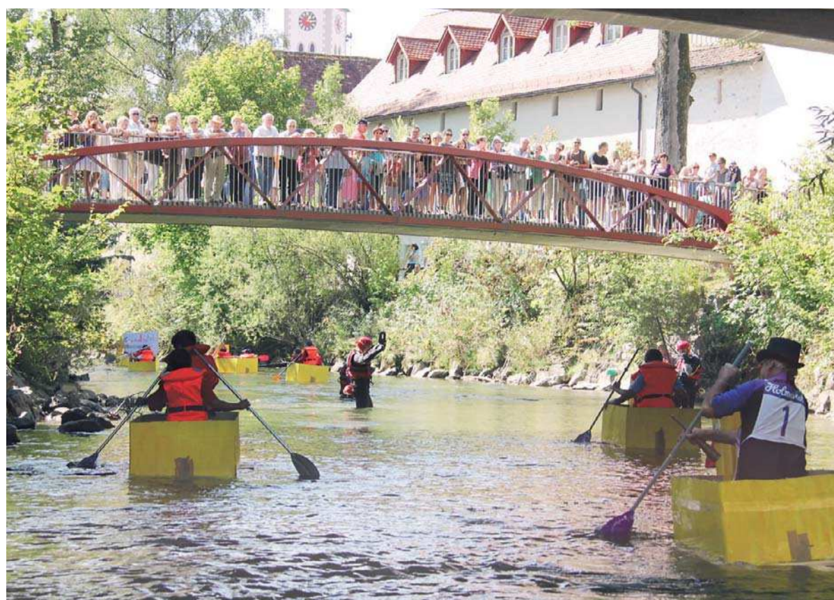
Das achte Wangener D' Arge nab verspricht für Teilnehmer und Zuschauer jede Menge Spaß.

Der Kaffeeautomat im Büro und ich: Das sind zwei, die nicht zusammen passen. Während andere Kollegen einfach aufs Knöpfchen drücken und sich Kaffee rauslassen, zeigt das Gerät beim mir in der Hälfte aller Fälle: „Bitte Wasser nachfüllen.“ Das allein wäre nicht das Problem, wäre da nicht die Tatsache, dass das Gerät die Meldung anzeigt, auch nachdem ich tat wie geheißen. Die Folge: Ich drückte wild eine Vielzahl weiterer Knöpfe. Und meist läuft irgendwann Kaffee raus. Übrigens auch, wenn ich keine Tasse unter den Hahn stelle. Aber das ist wirklich ein reines Anwenderproblem. (jps)